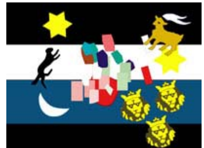
Was man alles mit einer EU-Flagge machen kann.